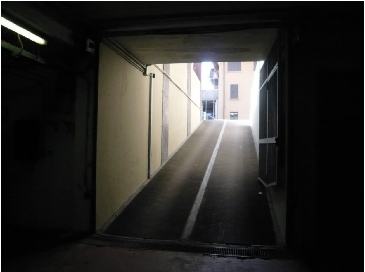
3. Una rampa di accesso al piano interrato