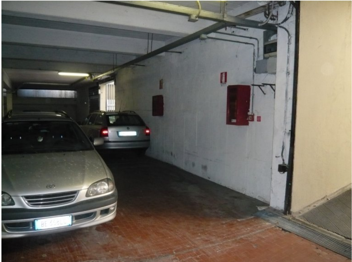
4. Il posto auto