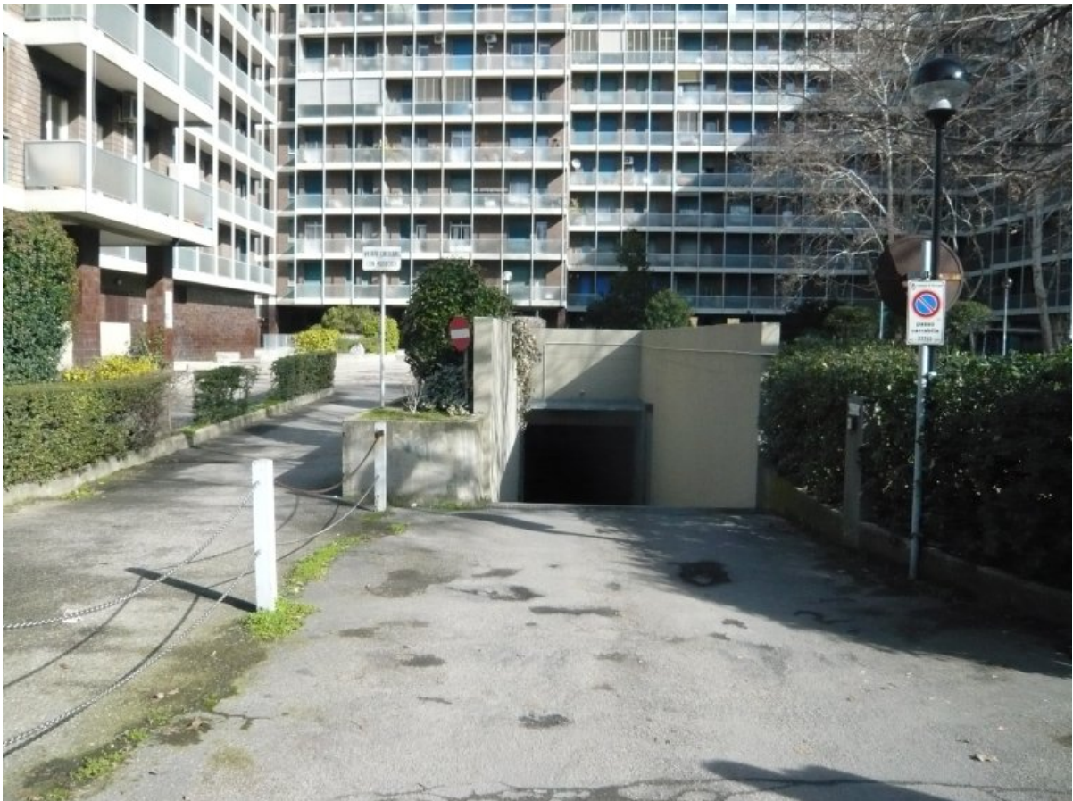
2. Vista di uno degli ingressi al primo piano interrato