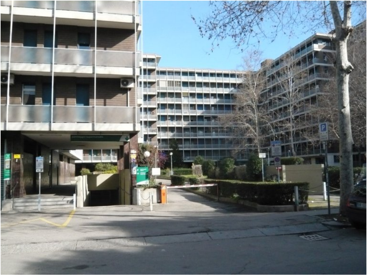
1. Vista del fabbricato da via Torreggiani